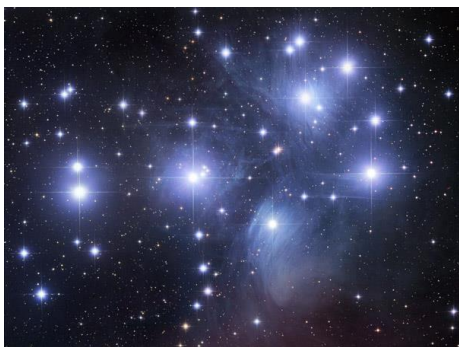
Stjärnhopen Plejaderna.

Nu när kvällarna blir mörkare tipsar vi om att upptäcka våra stjärnbilder. På Riksmuseets hemsida finns http://www.nrm.se/faktaomnaturenochrymden/rymden/denutidastjarnbilderna.2277.html